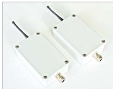
126 x 79 x h 42 mm (Dimensions)

MODRADIOIP65: Coppia di ricetrasmittitori RS232/RS485 per trasmissione dati in radio frequenza. Il sistema è composto da due MODRADIO: il primo modulo di trasmissione va collegato ad un indicatore/trasmittitore di peso con uscita seriale RS232/RS485; il secondo modulo riceve via radio i dati e viene collegato ad un ripetitore di peso o ad un PC/PLC.