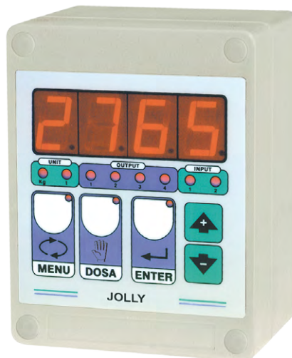
Montage boîtier mural (sur demande) Degré de protection IP64